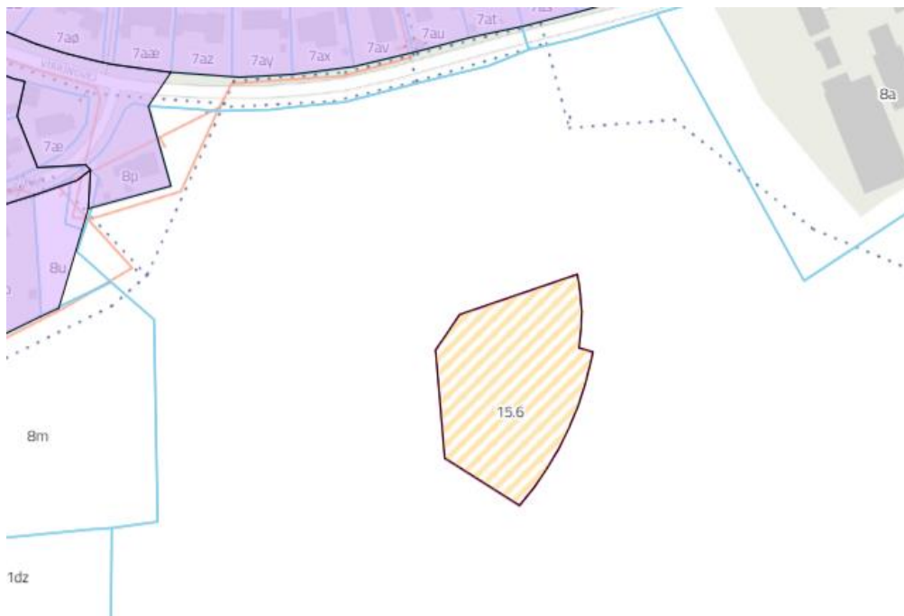
Figur 3 Byggefeltet udlægges til spildevandskloakeret opland 15.6