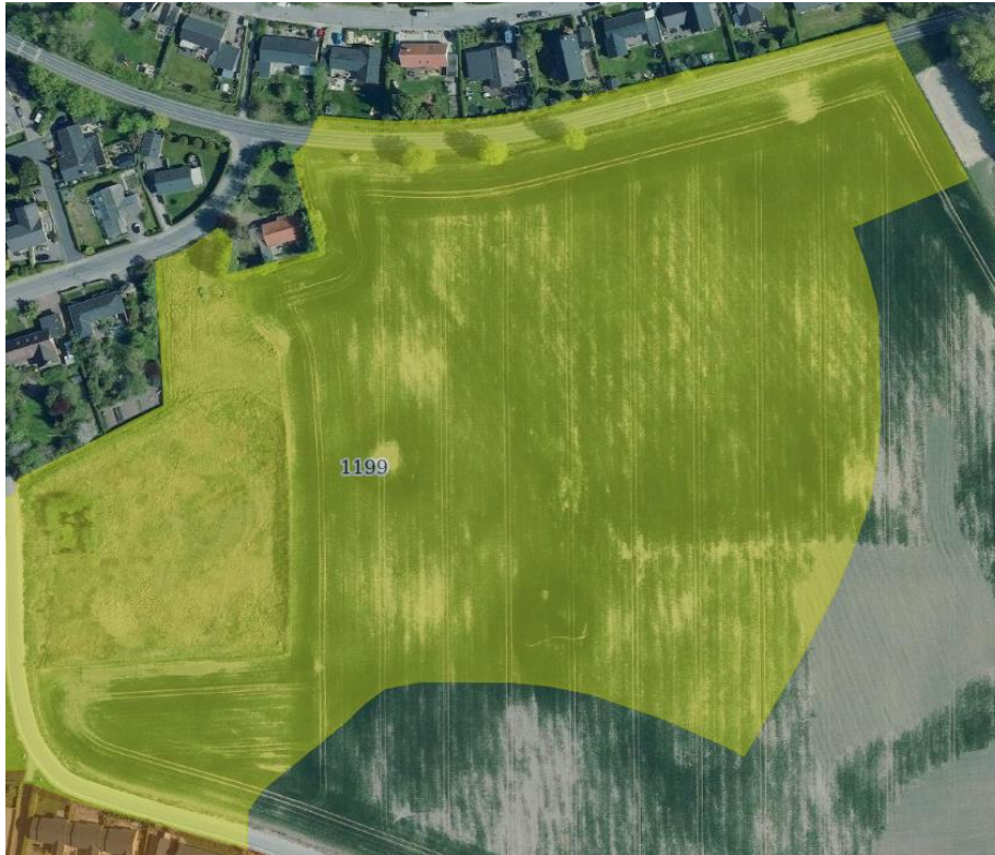
Figur 1 Området der omhandler lokalplan 1199

Der er ingen status situation da det er et barmarkprojekt, hvor området ikke tidligere har været bebygget eller forsynet med kloak.